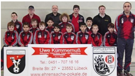
E2-Jugend Jahrgang 1999