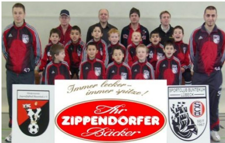
F2-Jugend Jahrgang 2001