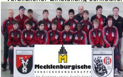
C1-Jugend Jahrgang 1994/95

Im Pokal wurde nach einem Freilos in der ersten Runde dann im Achtelfinale der TSV Eintr. Groß Grönau auswärts mit 2:0 besiegt. Im Viertelfinale hingegen kam gegen die wesentlich größeren und älteren Hünen aus Travemünde trotz vorbildlicher Einstellung schließlich das Aus.