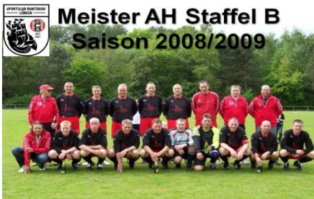
Altherren Saison 2008/09