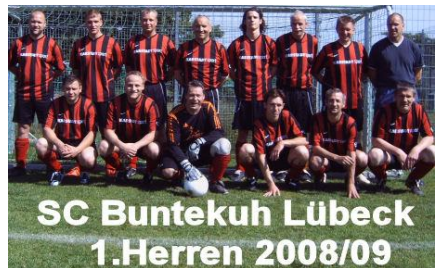
1. Herren Saison 2008/09

Einem Turniersieg bei der befreundeten SG Brunsbek/Witzhave folgte nach der erfolgreichen Vorrunde bei den Hallenmasters in der Endrunde noch ein 4. Platz