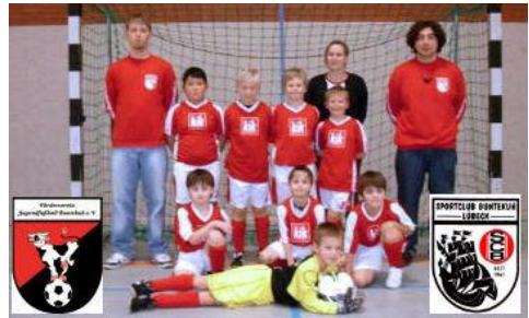
F1-Jugend Jahrgang 2000