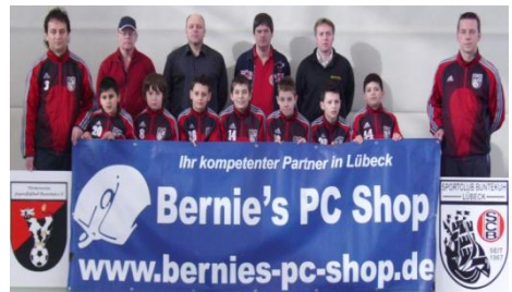
E1-Jugend Jahrgang 1998

wurde spätestens nach einem weiteren Turniersieg 2009 in Schackendorf und weiteren guten Platzierungen klar. Ein 5.Platz in der E-Jugend Kreisklasse C mit einem Torverhältnis von 106:23 spricht für sich. In der kommenden Saison wird dieses Team aufgrund dieser Resultate für die Qualifikation zur höchsten Spielklasse gemeldet. Mal sehen, was sich unser sehr motivierter Coach dann noch so einfallen lässt. Viel Glück und Erfolg bei dieser sehr schweren Aufgabe und vielen Dank für euer Engagement beim SCB.