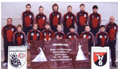
D2-Jugend Jahrgang 1996/97