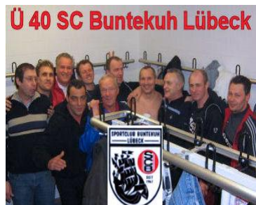
Ü-40 Kleinfeld Saison 2008/09