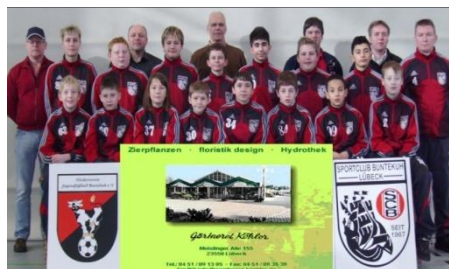
D1-Jugend Jahrgang 1996