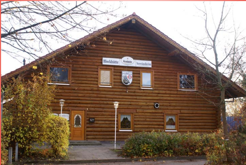
Vereinsheim Blockhütte frisch gestrichen von den fleißigen Helfern