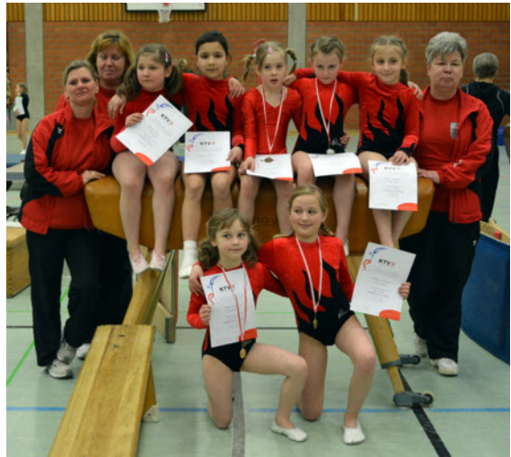
Einige Turnerinnen aus unserer Wettkampf- und Förderriege: