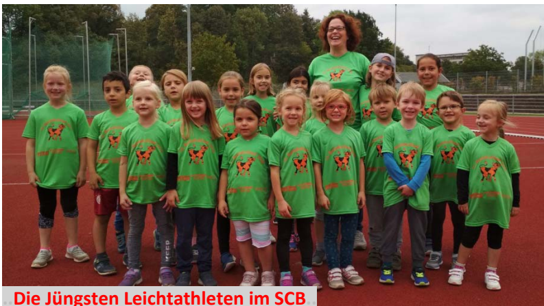
Die Jüngsten Leichtathleten im SCB