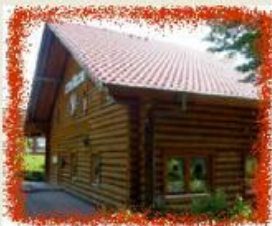
Koggenweg 1, 23558 Lübeck

Seminare, Konferenzen, Geburtstagsfeier, Hochzeit, ein Firmenjubiläum oder jede sonstige Veranstaltung: Das Vereinsheim „Blockhütte“ des Sportclub Buntekuh bietet immer einen besonderen Rahmen mit einem speziellen Flair, der Ihre Veranstaltung für Sie zum Erfolg und für Ihre Gäste zum Erlebnis macht.